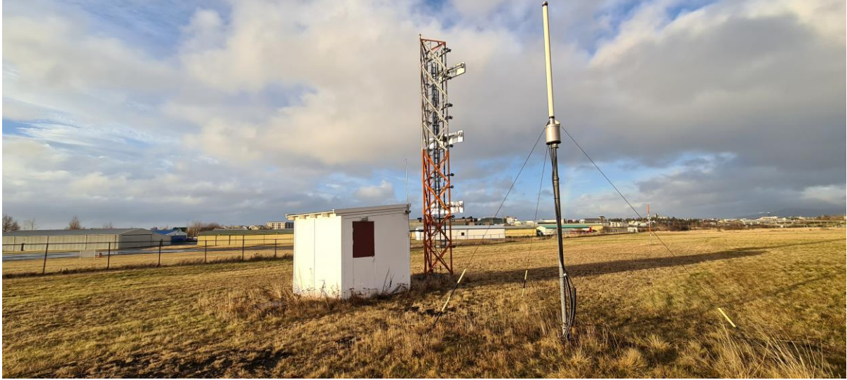
Mynd 2: Sambærilegt mastur á Reykjavíkflugvelli

Á mynd 2 má sjá sambærilegt mastur á Reykjavíkflugvelli en í því er innbyggður stigi þannig að auðvelt er að nálgast og þjónusta búnaðinn. Mastrið verður búið hindranalýsingu í efsta punkti.